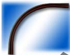
ข้อต่อโค้งไฟฟ้า พลี 90°