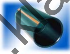
ข้อต่อสวมพลี A